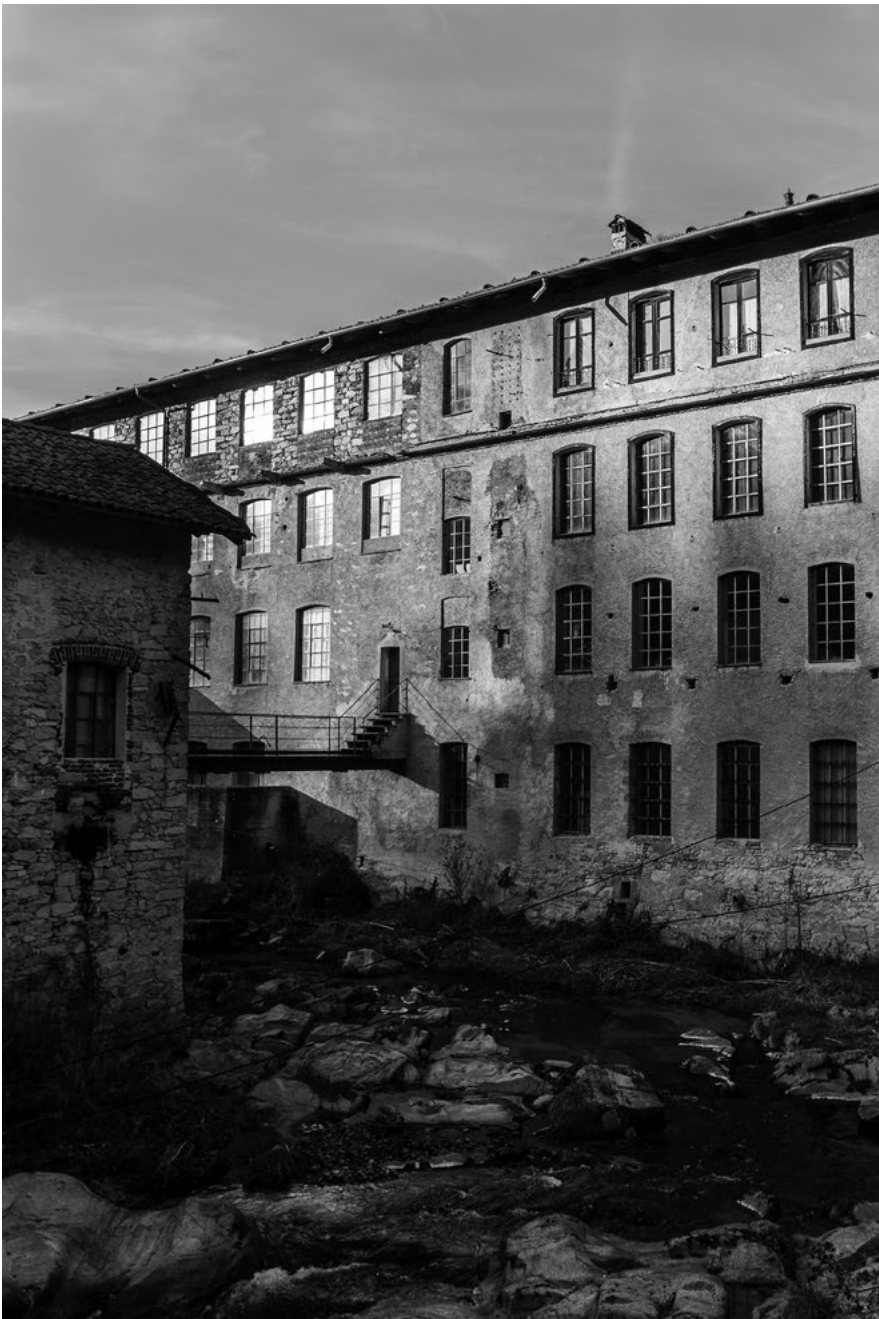
Figura 2. L'ex Lanificio Zignone, oggi conosciuto come la Fabbrica della Ruota, a Pray, in provincia di Biella. Vista del complesso industriale sul Torrente Ponzone, via Valle Fredda. Foto dell'autrice, 30 dicembre 2023.

conservazione e la messa in valore di questo patrimonio costituisce la mission originaria del DocBi» 13 . Tale obiettivo ha trovato la sua attuazione attraverso il progetto della Strada della Lana, avviato tra il 2005 e il 2007 grazie alla collaborazione tra il Dipartimento di Progettazione architettonica e di Disegno industriale del Politecnico di Torino e il DocBi – Centro Studi Biellesi.