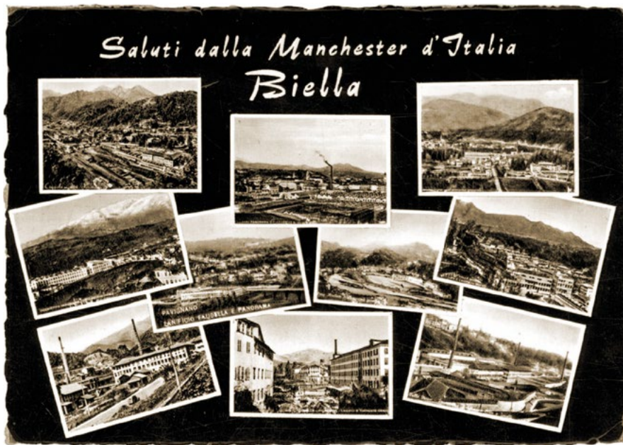
Fig. 1 - «Saluti dalla Manchester d'Italia», Biella, 1956, cartolina d'epoca.

che lavoravano la lana, ma è solo nel corso dell'Ottocento, con l'arrivo dei telai meccanici, che Biella acquisisce ancora più importanza 8 .